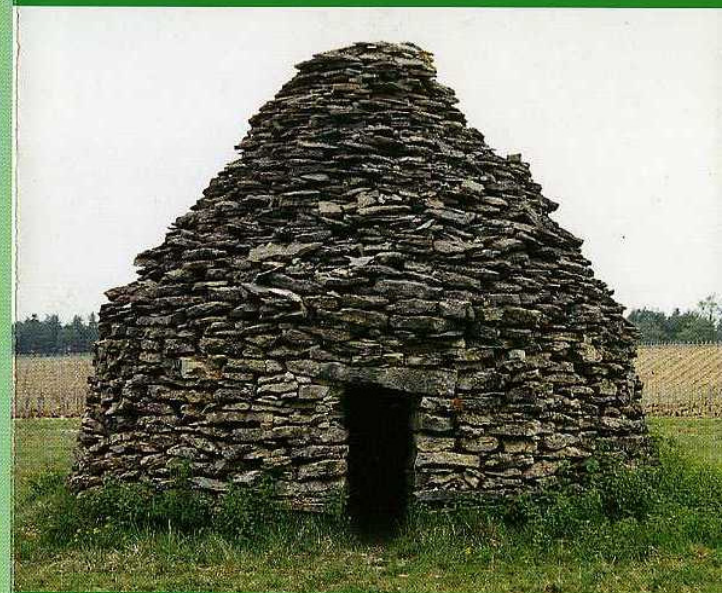
Grande Cadole Communale de Champraux de Devant