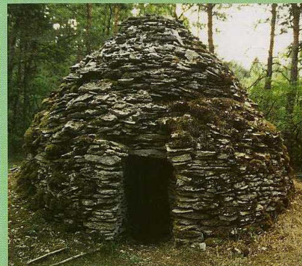
Grande Cadole du Val Fremelaire