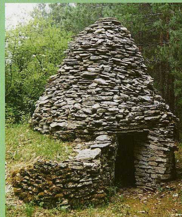
Le « Pain de Sucre »