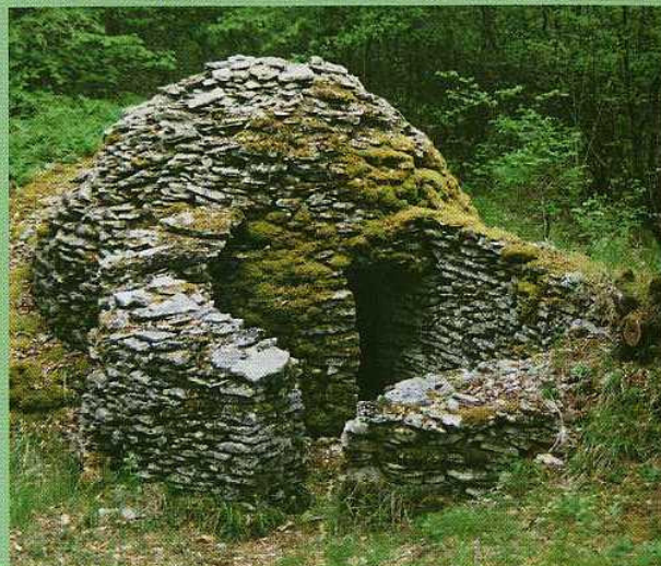
La « Merveille »

Nous sommes sûrs qu'une telle promenade-découverte ne pourra que vous enchanter et que vous ne manquerez pas de la signaler à vos amis.